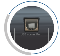
Interfaz de comunicación USB