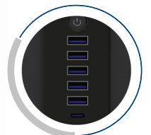
5 cargadores USB TIPO-A y 1 cargador USB Tipo-C