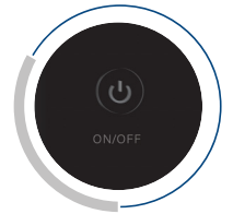
Botón ON / OFF y arranque en frío