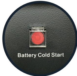
Arranque de baterías en frío.