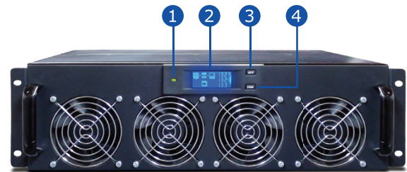
Módulos de potencia de 20 kVA a 208vac y 30 kVA a 380vac