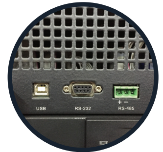
Conectores USB - RS-232 -RS-485