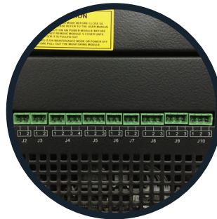
Contactos secos. (del J2 al J10)