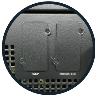
SNMP e Interfaz de la tarjeta inteligente