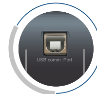
Interfaz de comunicación USB