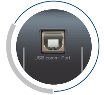
Interfaz de comunicación USB