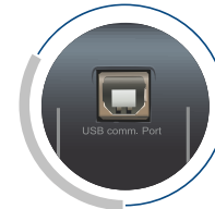
Interfaz de comunicación USB