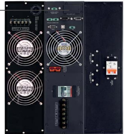
Transformador de aislamiento