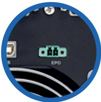
Función opcional de Apagado de Emergencia (EPO)