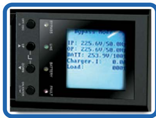
Display LCD Muestra voltajes de entrada, salida, tiempos de autonomía y carga de batería.