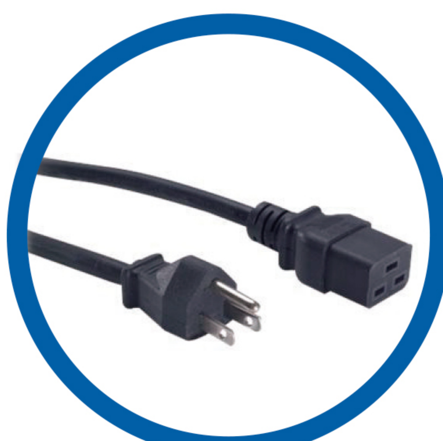
Conectores NEMA 5-15P / IEC-C19