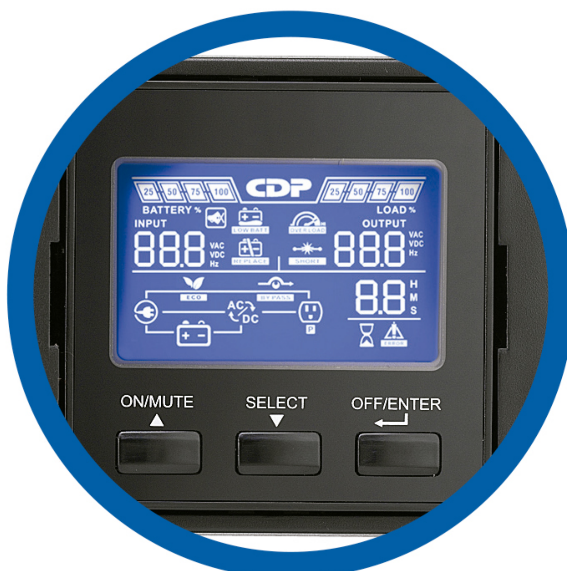
Panel LCD con rotación de 90°