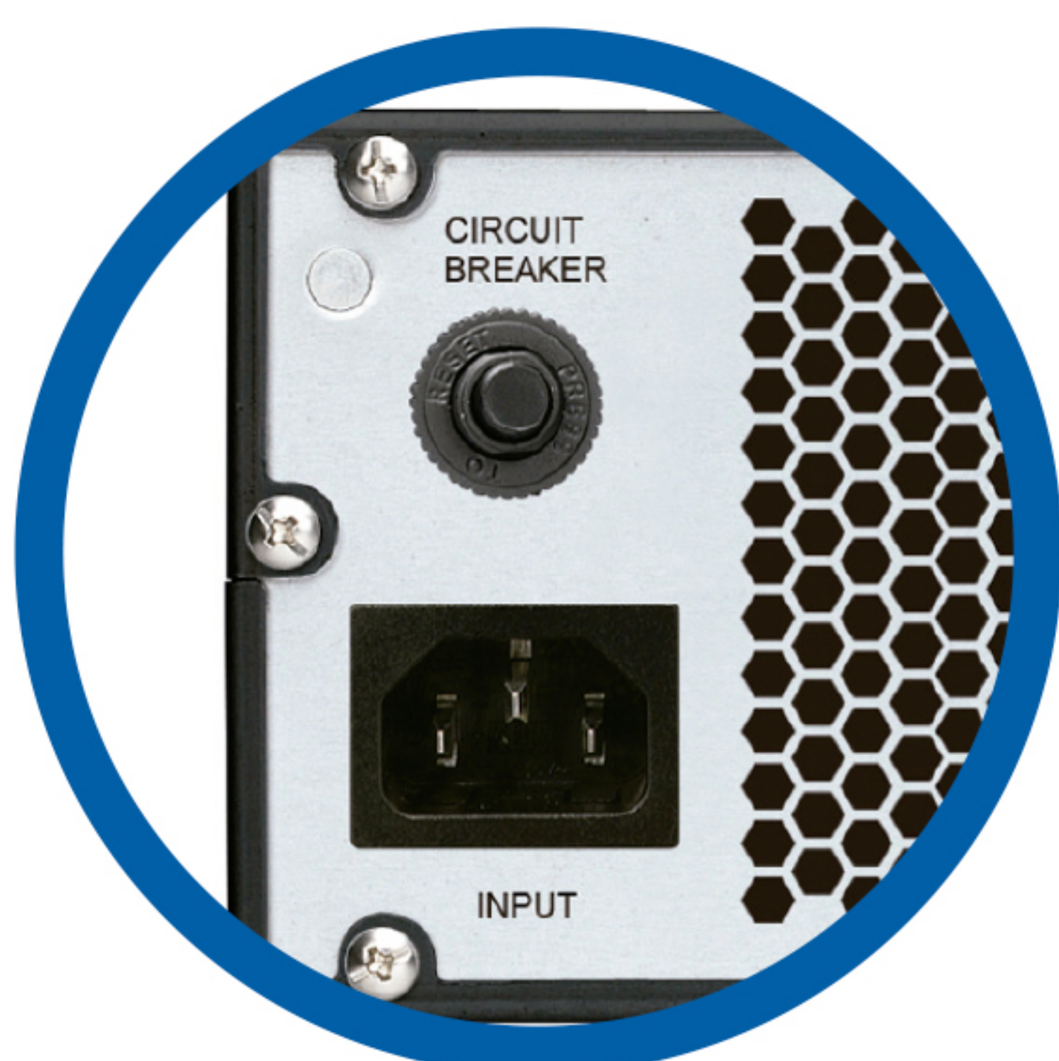
Conector de chasis IEC-C20 y Breaker de protección