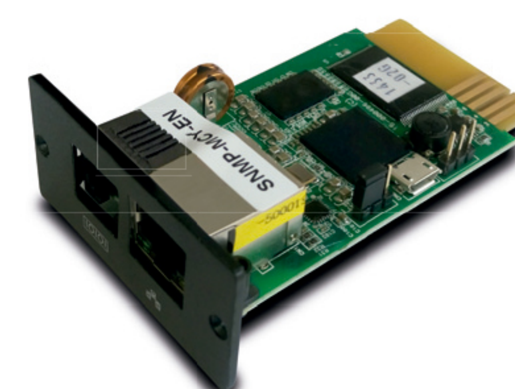
Tarjeta opcional: EMD (Dispositivo de monitoreo ambiental)