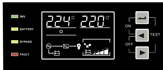
Display LCD Muestra voltajes de entrada, salida y carga de batería.