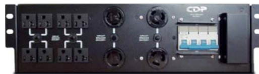
Compatible con unidad de distribución de energía (PDU) se vende por separado