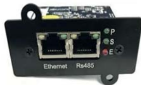
Tarjeta opcional: UPO22 SNMP