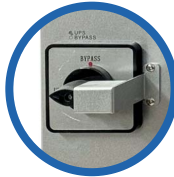
Conmutador de BYPASS de mantenimiento