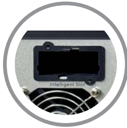
Slot para tarjeta SNMP